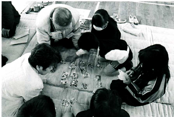
カルタ遊びを選択し、地域の人とふれ合う中で存在感を抱く生活科授業