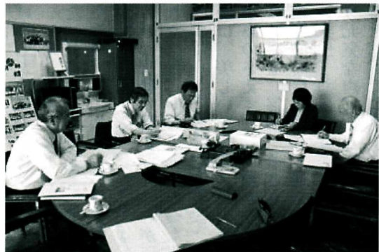
市校長会研究推進委員会

今後も、授業の中で三機能を有効に生かすことにより、温かな人間関係の中で充実した教育活動をし、児童一人ひとりの個性の伸長と自己実現を図り、充実した教育活動が推進できるよう改善に努めていきたい。